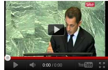
Nicolas Sarkozy à l'ONU 21 septembre 2011

Comme feu René Rémond, son prédécesseur à la présidence de « Liberté pour l'Histoire », en confessant « ne pas être spécialiste », P. Nora révèle que sa posture sur l'extermination des Arméniens est ipso facto purement politique, alors même qu'il exige des élus de la nation (dont certains sont plus documentés que lui sur le sujet) qu'ils désertent, eux, le champ de l'histoire http://www.collectifvan.org/article.php?r=0&id=9367